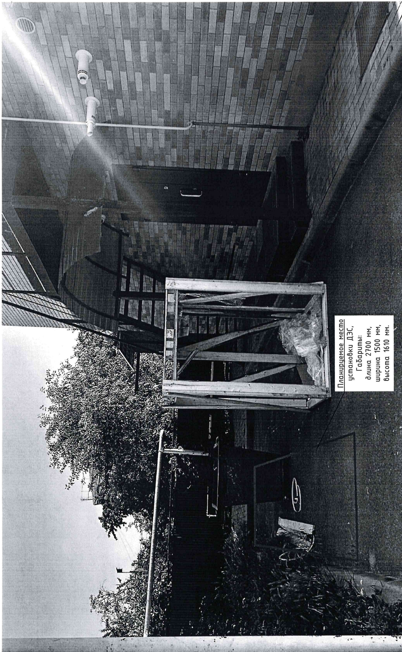
Планируемое место установки ДЭС, Габариты: длина 2700 мм, ширина 1500 мм, высота 1610 мм.